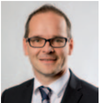
Grant Hendrik Tonne Niedersächsischer Kultusminister

Auf dieser Grundlage werden Sie eine fundierte Entscheidung für den weiteren Bildungsweg Ihres Kindes treffen können. Ein glückliches Kind, das den Anforderungen der gewählten Schulform motiviert begegnet, sollte das gemeinsame Ziel sein.